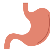
Πόνος στο στομάχι